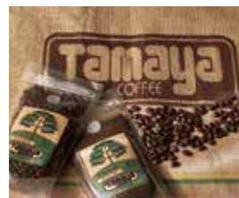
玉屋珈琲店 25日のみ NEW 〈いけ〉