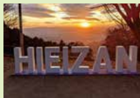
ケーブル比叡駅前ではフォトスポットやかわら投げも

会場の店舗をご利用の方に 『叡山ケーブル・ロープウェイ』 往復乗車券割引クーポン を呈呈！（予定枚数限り）