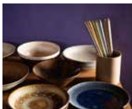
箸蔵 まつかん 〈もり〉