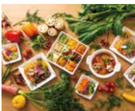
SouZai屋 25日のみ NEW 〈かわ〉