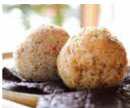
和久里のごはんやおくどさん わっぱ堂 〈かわ〉