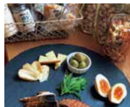
燻製マーケット 25日のみ NEW 〈いけ〉