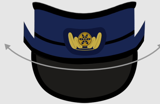
②ぜんたいを うしろへ カールさせます