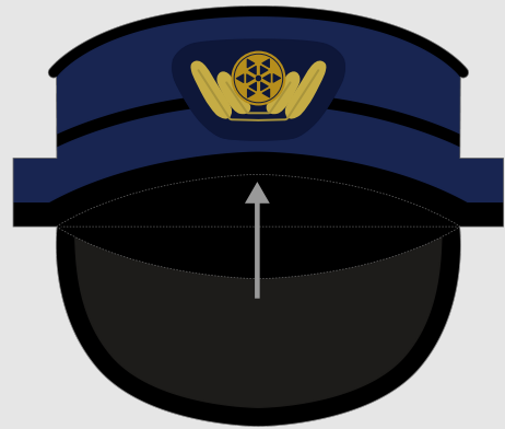
①つばのぶぶんを うえにむかって おります